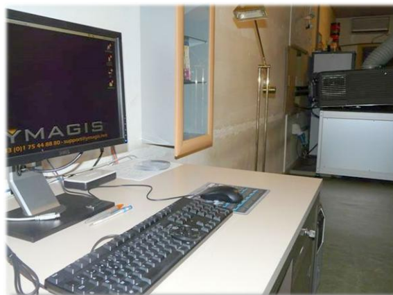
Cinema Albert (Dendermonde, Belgique) www.cinema-albert.be